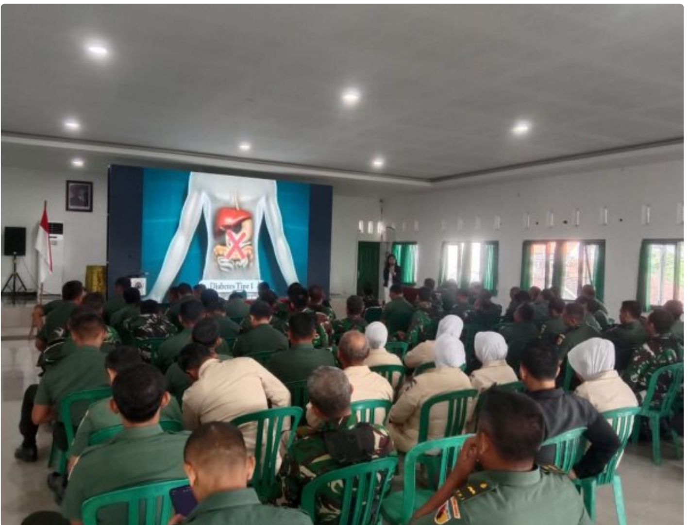
Prajurit dan PNS Kodim 0804/Magetan Terima Penyuluhan Kesehatan Tentang Bahaya Diabetes Melitus

Magetan. Kodim 0804/Magetan, bekerja sama dengan Yayasan Penyuluhan Kesehatan Indonesia, mengadakan penyuluhan kesehatan bertema Diabetes Melitus atau kencing manis, Senin (17/2/2025). Acara ini bertujuan untuk