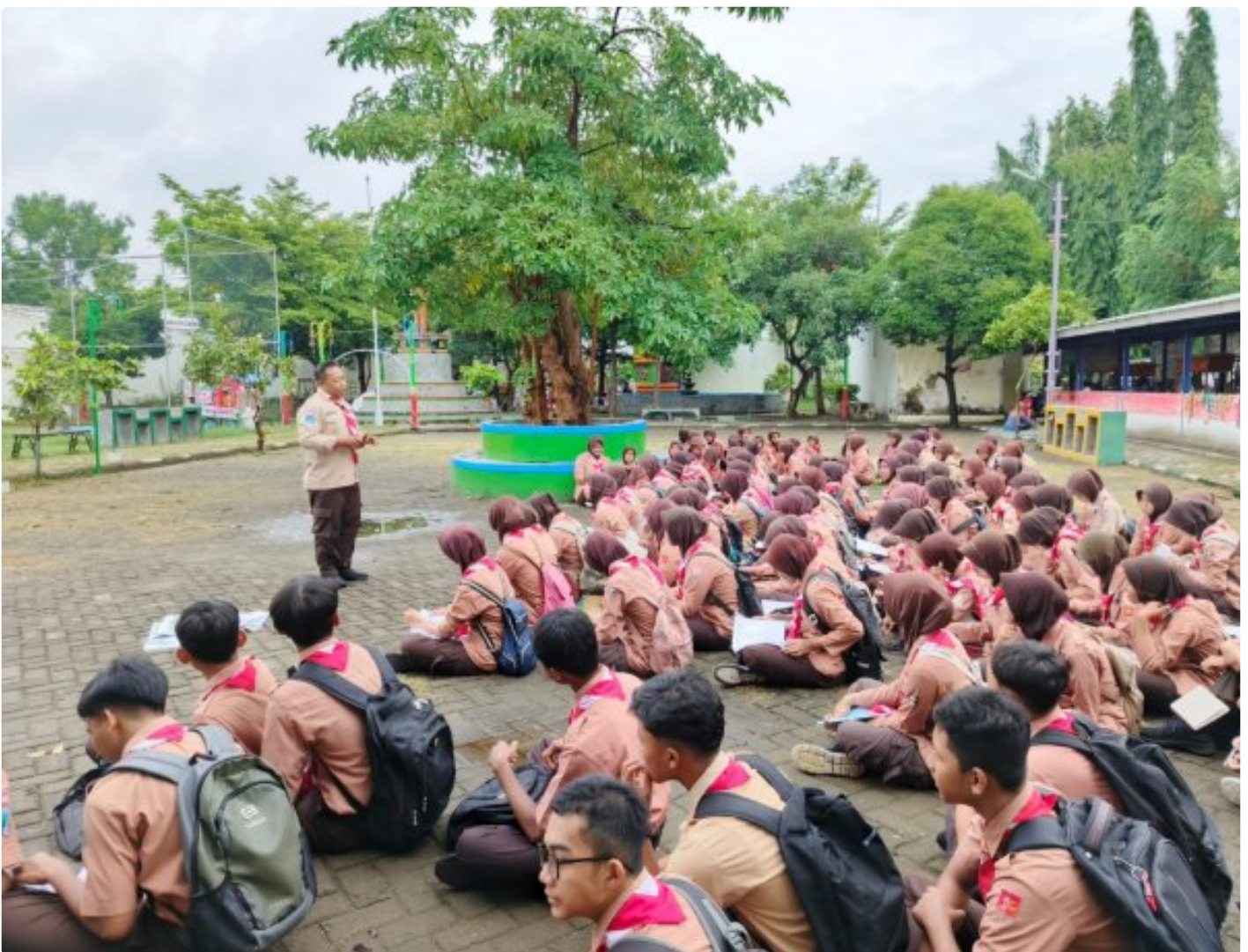
Pembinaan Pramuka Saka Wira Kartika Materi Krida Navigasi Darat Untuk Pengembangan Keterampilan

Magetan. - Dalam rangka memperkuat kemampuan dan keterampilan anggota Pramuka Saka Wira Kartika melaksanakan pembinaan dan pelatihan Krida Navigasi Darat (Navrad). Acara ini diikuti oleh 125 orang anggota pramuka dari