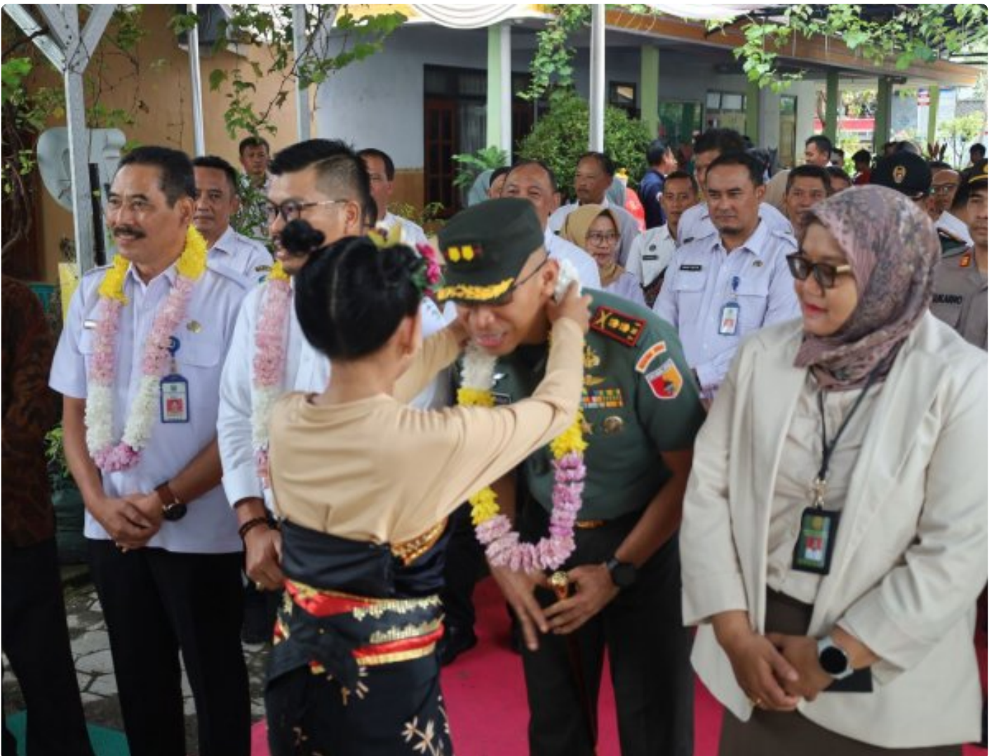
Dukung Program Pemerintah, Dandim 0804/Magetan Hadiri Musrenbang Tingkat Kecamatan