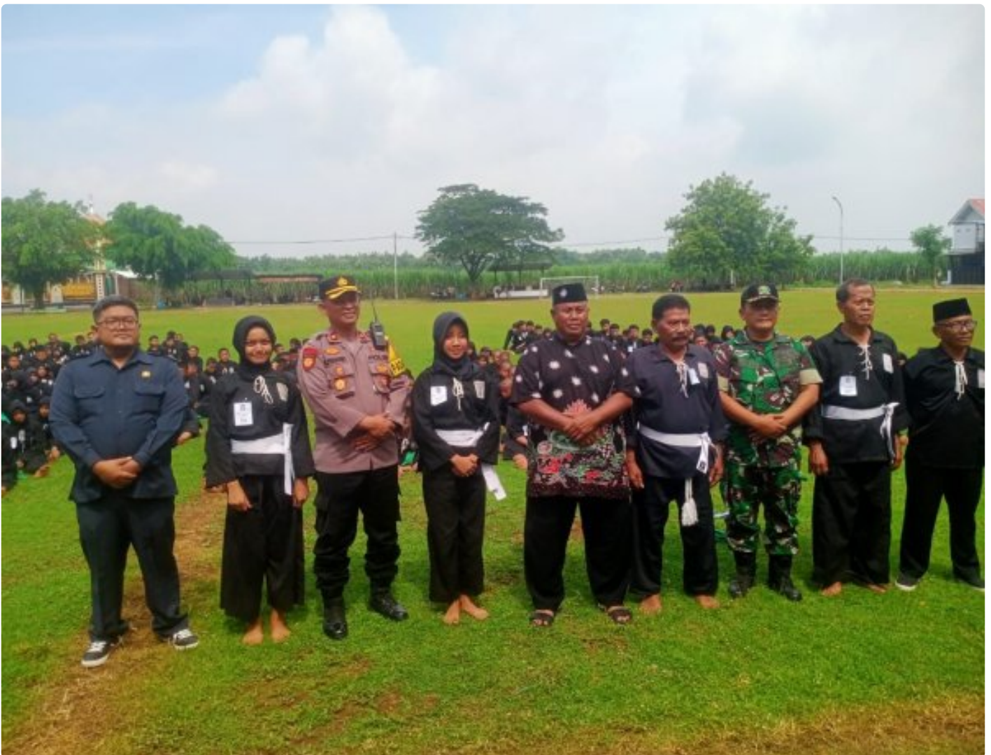
Danramil 0804/06 Maospati Hadiri Tes Kenaikan Tingkat Siswa PSHT Ranting Maospati

Magetan. - Salah satu tahapan yang harus diikuti oleh setiap siswa Persaudaraan Setia Hati Terate (PSHT) sebelum menjadi anggota atau warga adalah mengikuti rangkaian tes kenaikan sabuk.