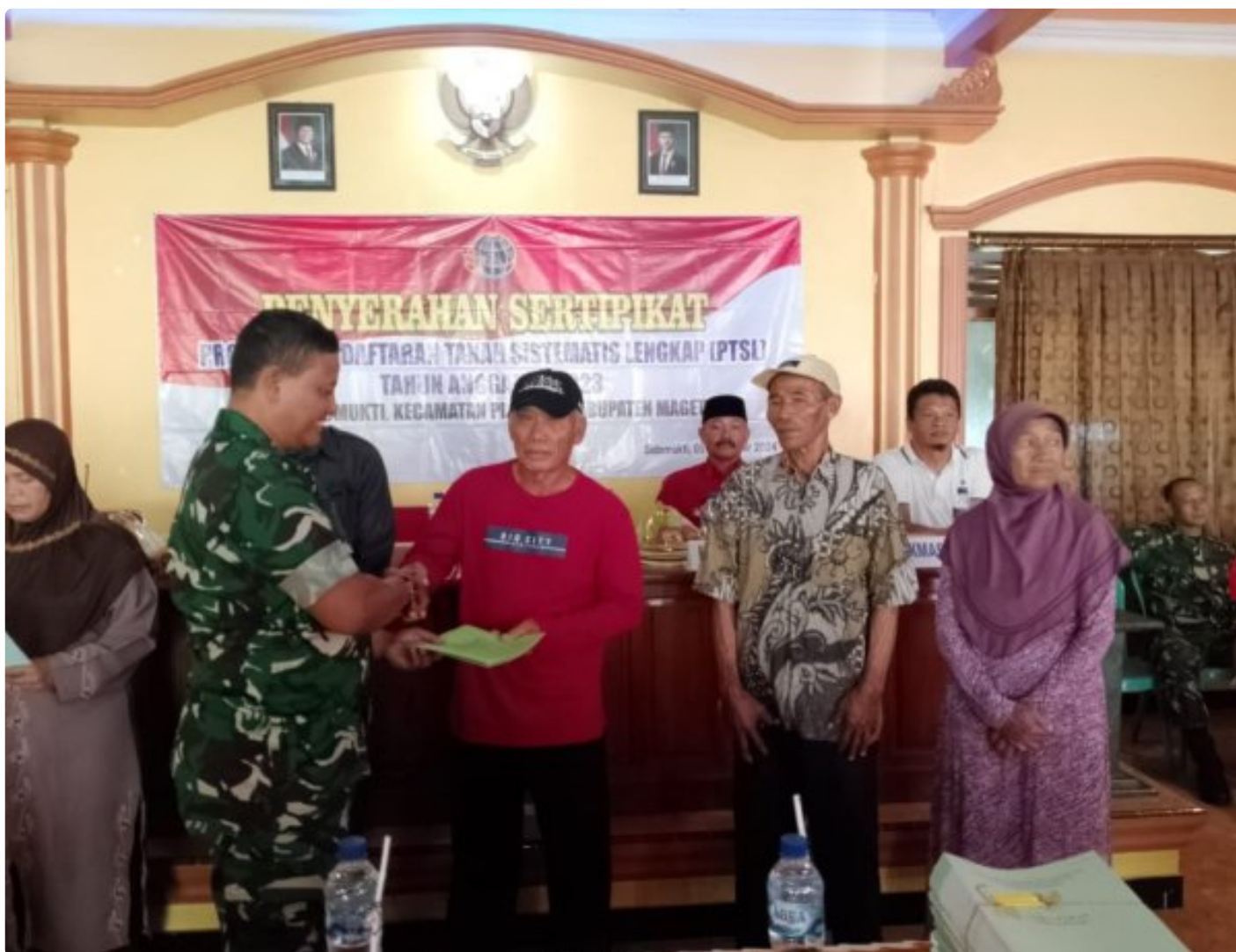
Danramil 0804/02 Plaosan Hadiri Penyerahan Sertifikat Program Pendaftaran Tanah Sistematis Lengkap (PTSL) Desa Sidomukti

PLAOSAN. - Desa Sidomukti melalui Badan Pertanahan Nasional (BPN) melakukan penyerahan Sertifikat Tanah Program Pendaftaran Tanah Sistematis