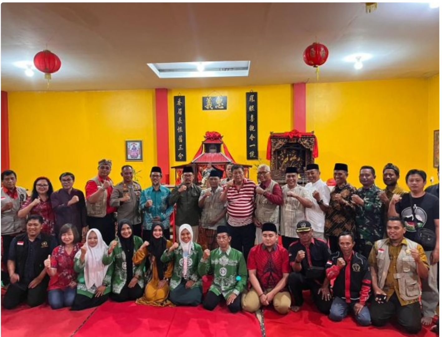
Danramil 0804/01 Magetan Bersama Forkopimca Hadiri Kegiatan Do'a Bersama Peringati Imlek Tahun Baru Saka 2576/2025